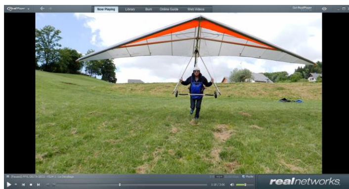
Maîtriser son incidence au décollage

Voici le premier de la série sur le décollage, axé sur la notion de « Maîtrise de l'incidence de l'aile »